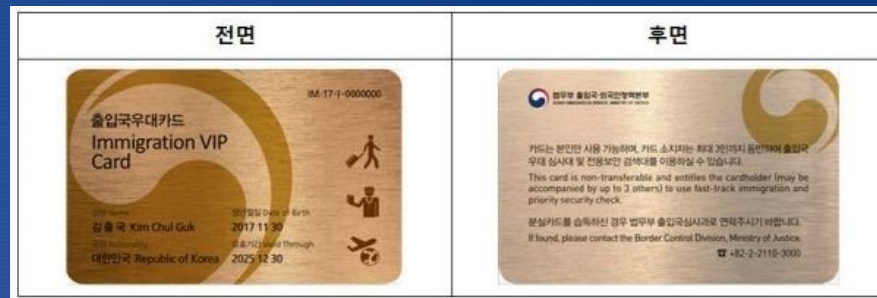
Иммиграционная преференциальная карта Министерства юстиции