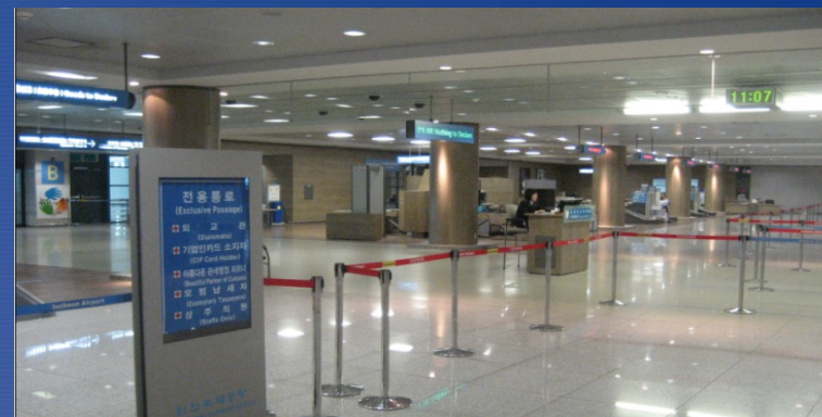
Отдельный проход в зал прилета на 1 этаже