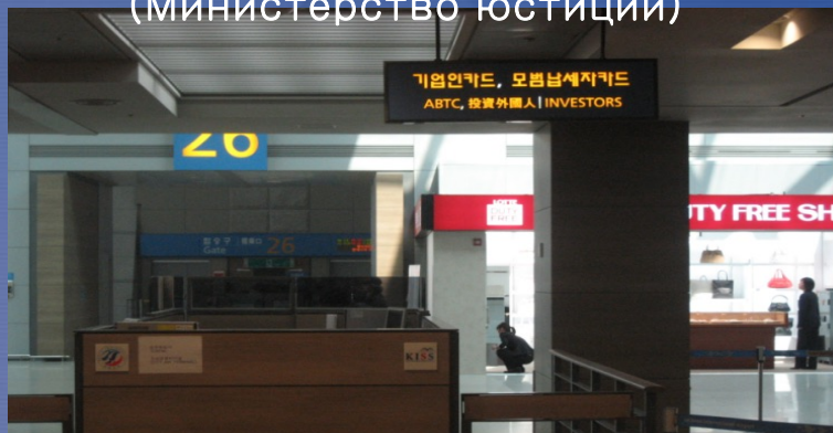
Специальный иммиграционный контрольно-пропускной пункт