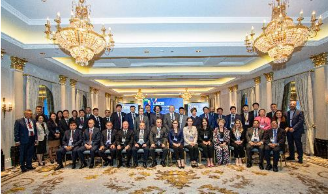
Knowledge-Sharing Event: Single Window for Digital Customs Cooperation in CAREC, 8 June 2023