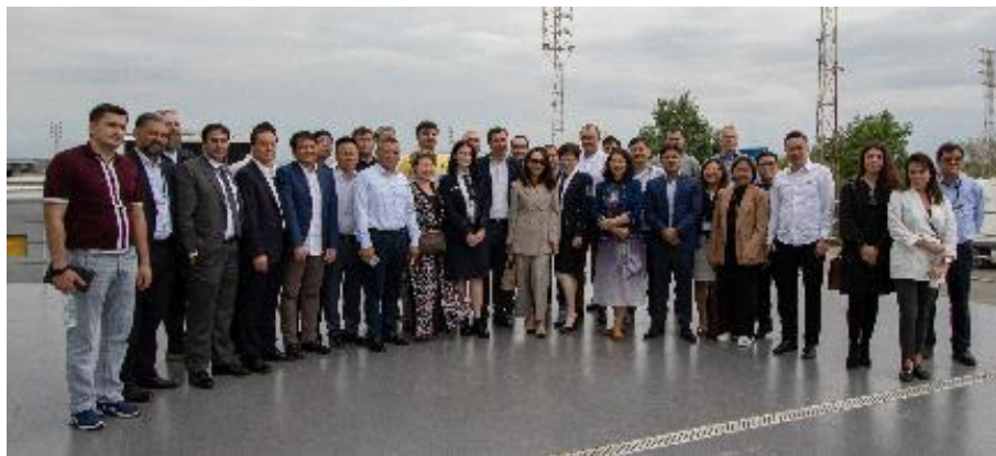
Посещение Тбилисской таможенной зоны оформления, 10 июня 2023 г.