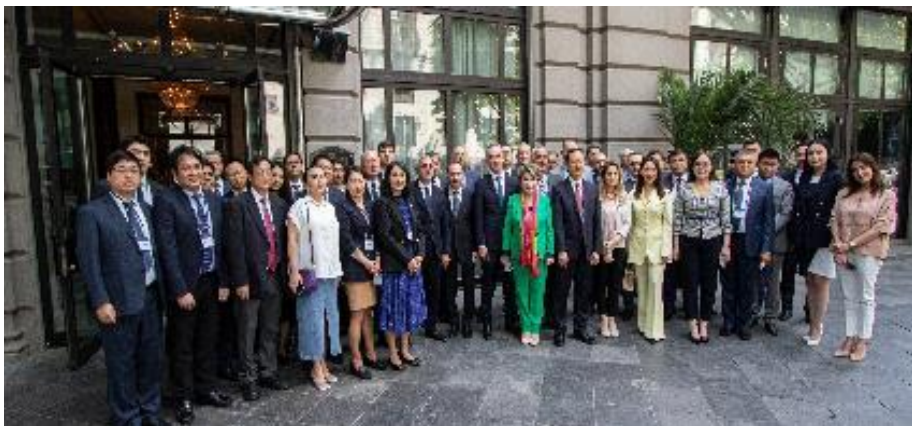
22-е заседание КТС ЦАРЭС, 9-10 июня 2023 г.