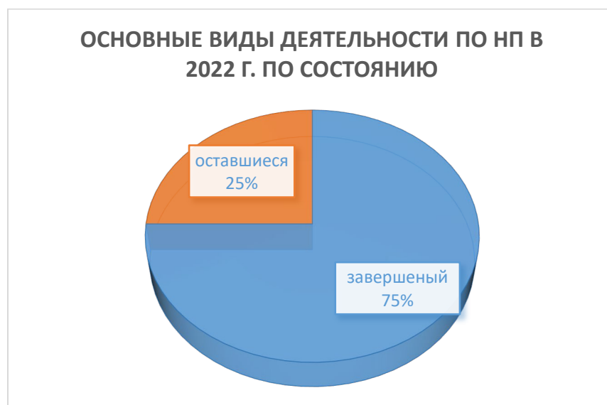
Рисунок 1. Состояние деятельности по наращиванию потенциала Института ЦАРЭС на 2022 год

Благодаря обновленной инфраструктуре электронного обучения Институт полностью подготовился (в первой половине 2022 г.) к применению гибридных методов НП во второй половине 2022 г. (подробности отражены на слайде по НП в прилагаемой презентации). В 2022 году целевым участникам будет предложено сочетание очных, прямых трансляций и записанных семинаров, что позволит вовлечь их в полный цикл развития потенциала.