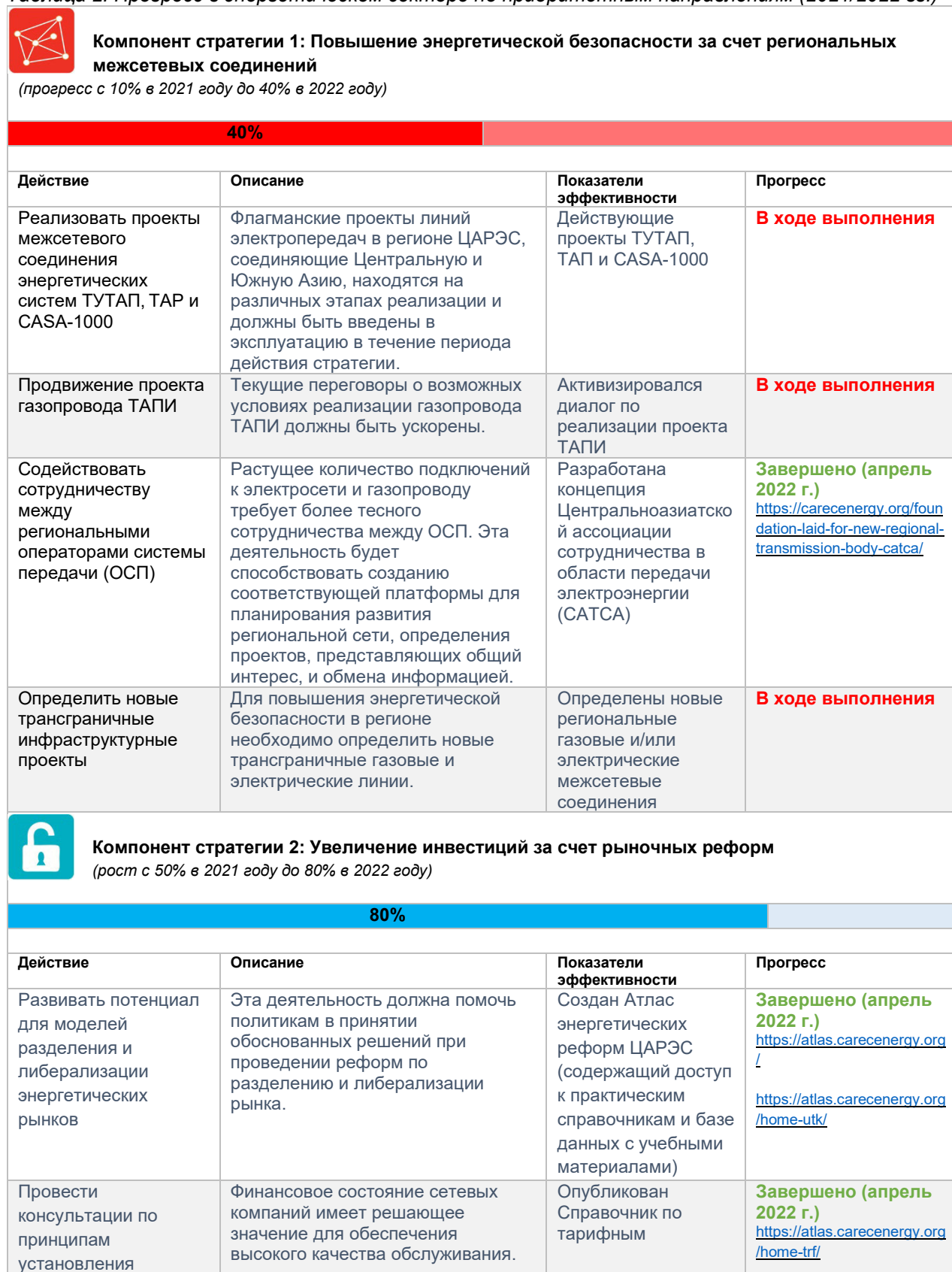
Таблица 2: Прогресс в энергетическом секторе по приоритетным направлениям (2021/2022 гг.)