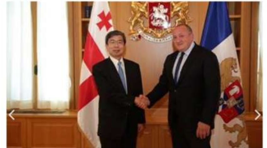
ADB President visits Georgia, reaffirms commitment to expand partnership

CAREC Workshop On Trade And Trade Facilitation Reforms—WTO Trade Facilitation Agreement And Consolidated Trade Agenda