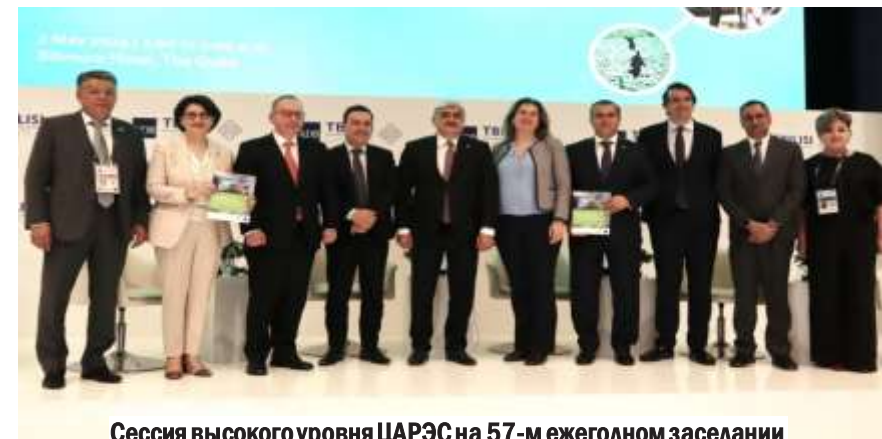
Сессия высокого уровня ЦАРЭС на 57-м ежегодном заседании

АБР: «Финансирование более экологических цепочек добавленной стоимости в регионе ЦАРЭС» (Тбилиси, май 2024 г.)