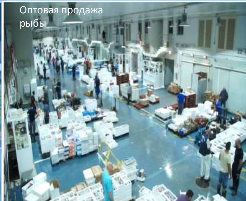
Оптовая продажа рыбы