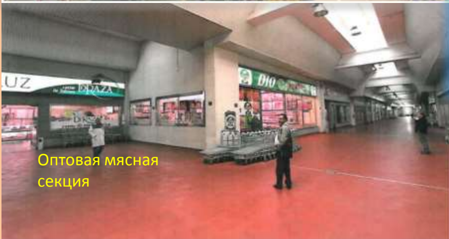
Оптовая мясная секция