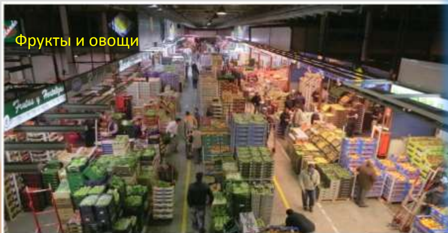
Фрукты и овощи