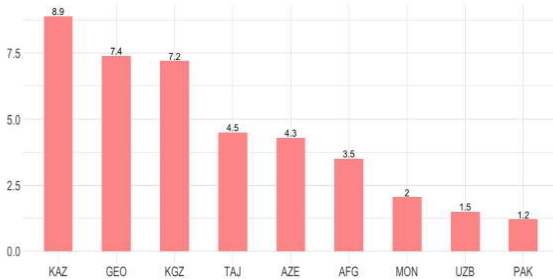
Пакеты фискальной поддержки Как доля ВВП, на 5 июня 2020 г.