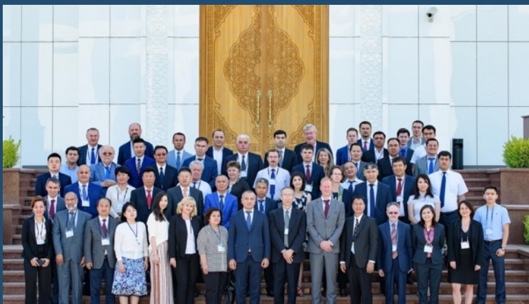
Торговый кластер ЦАРЭС

https://www.carecprogram.org/?page_id=13249