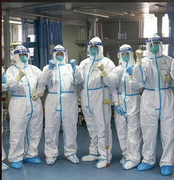
2. Больницы – прекращены услуги поликлиник