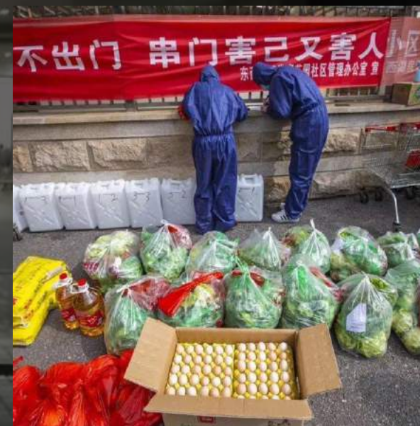
3. Жилые районы – строгая изоляция