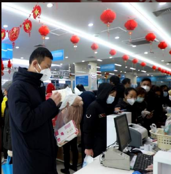
1. Аптеки – длинные очереди