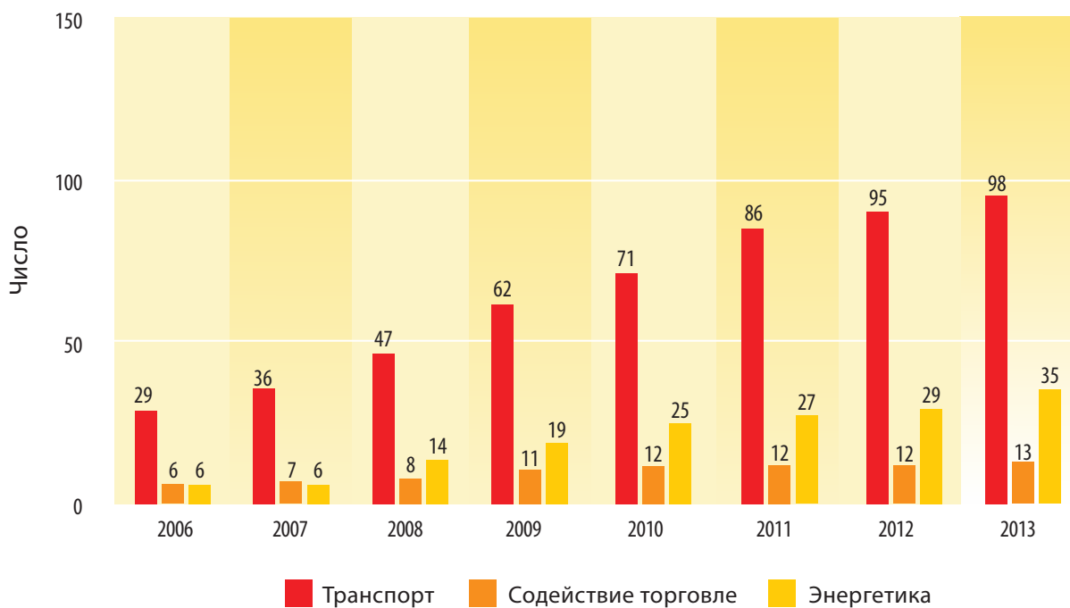
Рисунок 3: Совокупное число утвержденных проектов, связанных с ЦАРЭС, с 2001 года

ЦАРЭС = Центральноазиатское региональное экономическое сотрудничество.