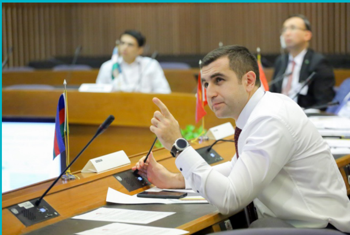
Заседание Рабочей группы по железнодорожному транспорту ЦАРЭС, 12-13 декабря 2019 года, Бангкок

Во-первых, железные дороги зарекомендовали себя в качестве важного вида транспорта для перевозки международных грузов на дальние расстояния в регионе ЦАРЭС во время кризиса COVID-19. Так как при железнодорожных перевозках требуется меньшее взаимодействие между людьми, чем при автомобильных перевозках, а железнодорожные тарифы более конкурентоспособны, чем тарифы на грузовые авиаперевозки, во время кризиса COVID-19 многие грузоотправители и экспедиторы