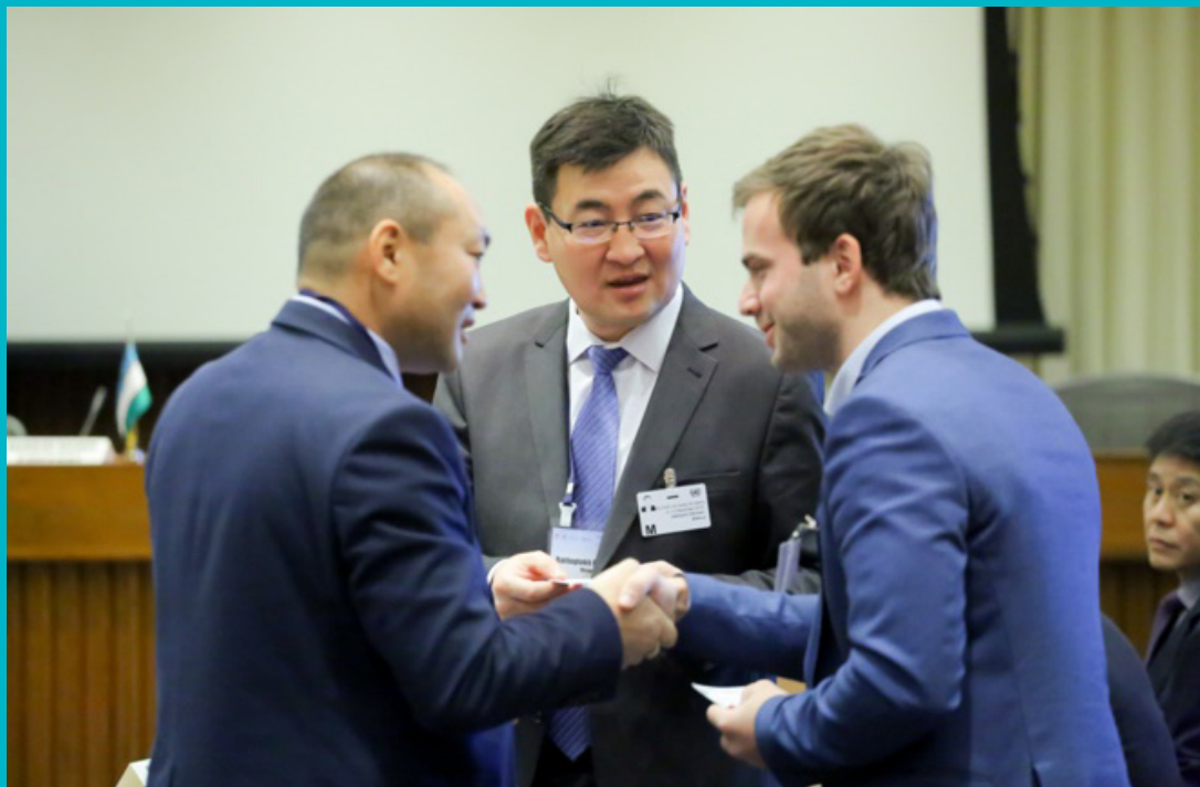
Заседание Рабочей группы по железнодорожному транспорту ЦАРЭС, 12-13 декабря 2019 года, Бангкок