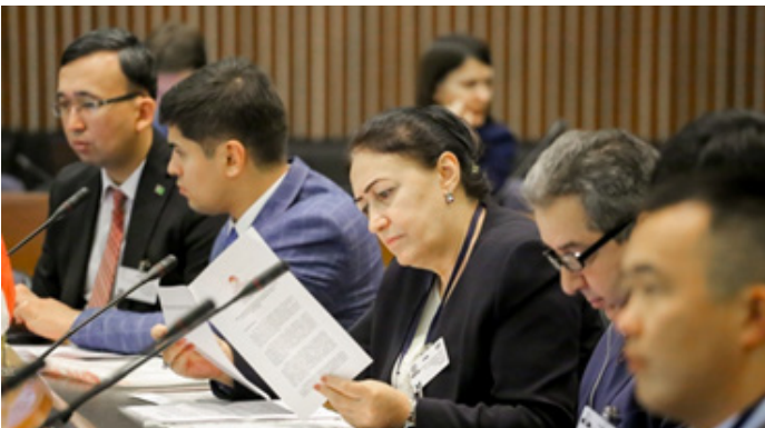
Заседание Рабочей группы по железнодорожному транспорту ЦАРЭС, 12-13 декабря 2019 года, Бангкок