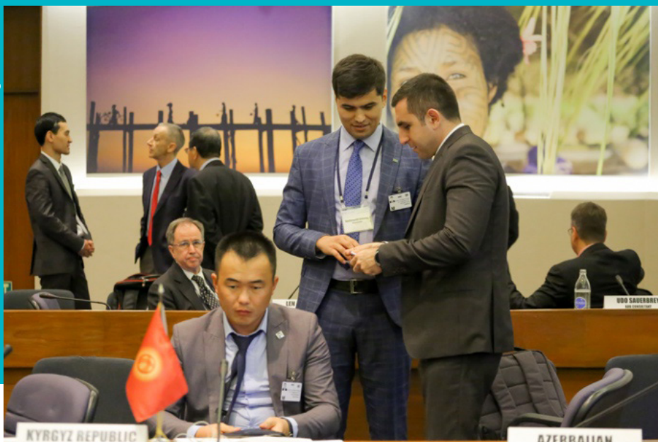
Заседание Рабочей группы по железнодорожному транспорту ЦАРЭС, 12-13 декабря 2019 года, Бангкок

путей и составления расписания, включая демонстрации. Эта инициатива будет продолжена на следующем пленарном заседании РГЖТ.