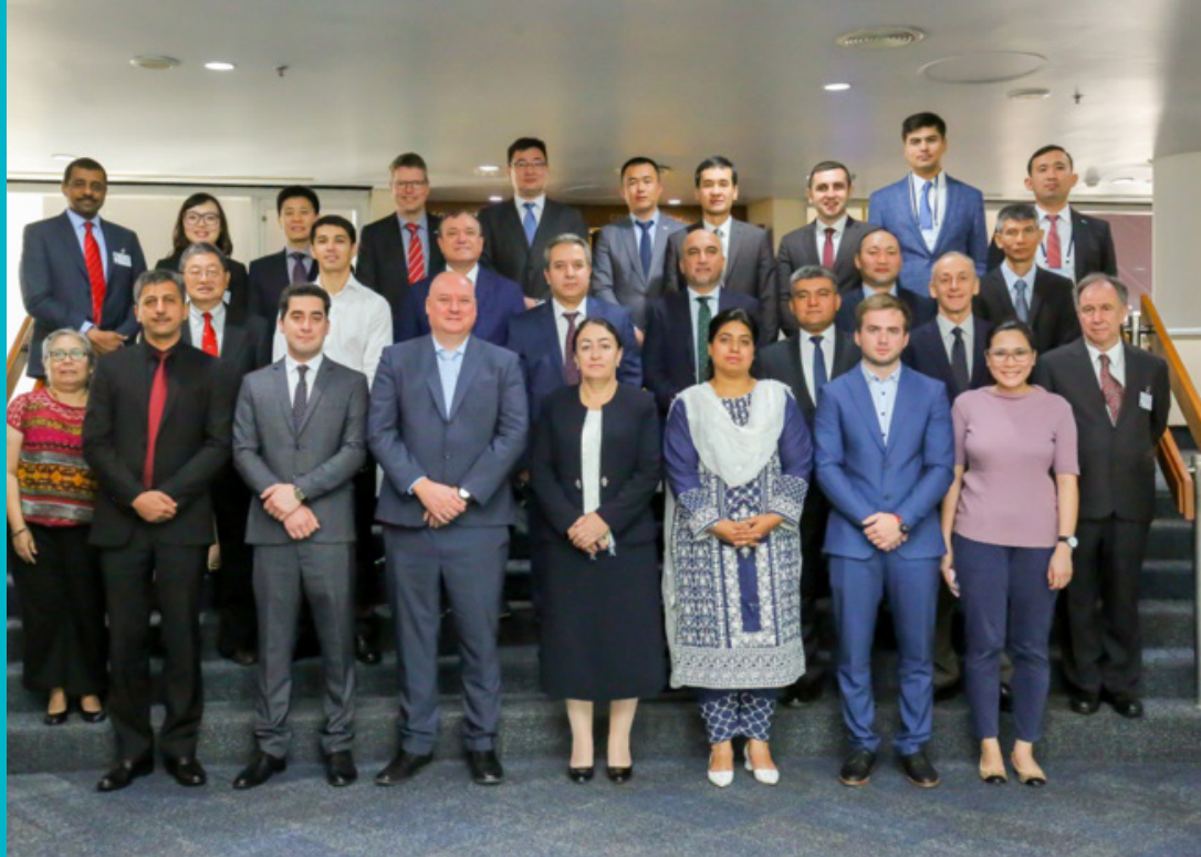
Заседание Рабочей группы по железнодорожному транспорту ЦАРЭС, 12–13 декабря 2019 года, Бангкок