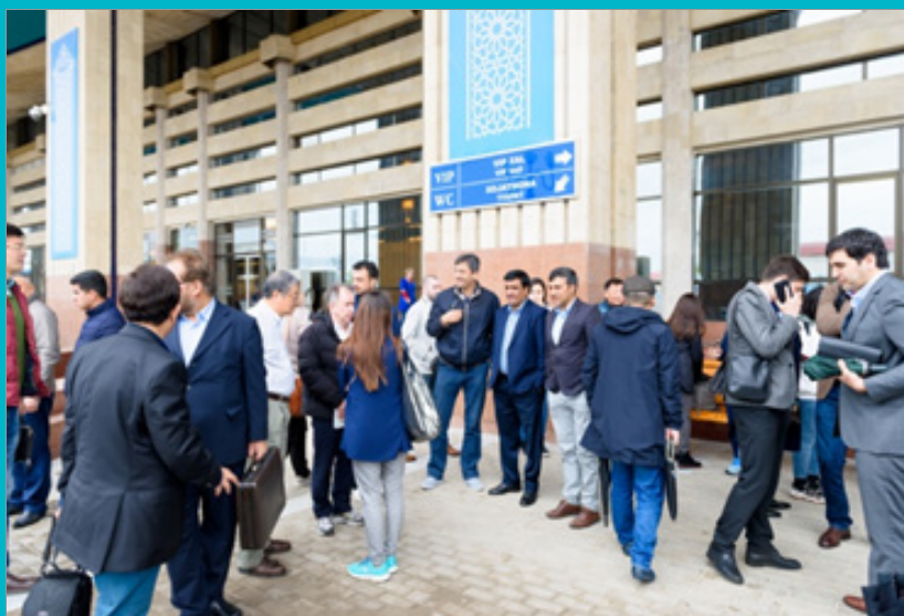
Поездка на высокоскоростном поезде Ташкент – Самарканд, 22 апреля 2019 года