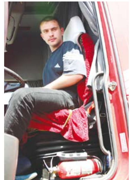
Проект поддерживает пограничное соглашение между КНР, Кыргызской Республикой и Таджикистаном, которое облегчит торговлю и сократит время на передвижение.

Проект стоимостью в 116 миллионов долларов США (см. план финансирования ) преследует четыре задачи. В его рамках будут модернизированы 263 км дороги с двухсторонним движением от Сары Таш, Кыргызской Республики, до Нимич, Таджикистана, что откроет самый прямой маршрут из КНР до Центральной и Южной Азии. Это улучшит пограничные пересечения Кыргызская Республика-КНР в Иркештаме