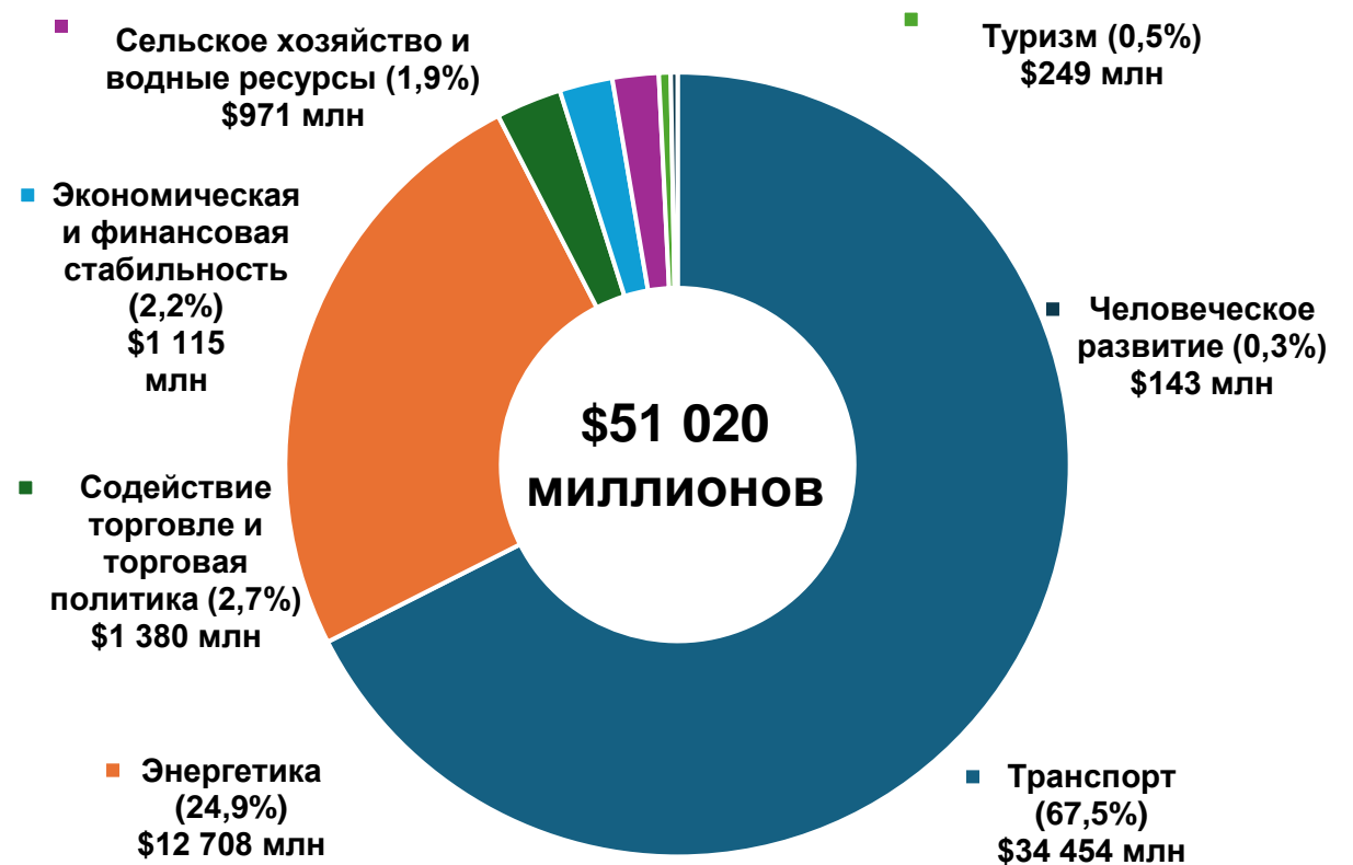
Инвестиции ЦАРЭС по секторам (по состоянию на декабрь 2023 г.)

*Объем инвестиций ЦАРЭС все еще может измениться после продолжающегося анализа базы данных портфеля ЦАРЭС при консультациях с партнерами по развитию.