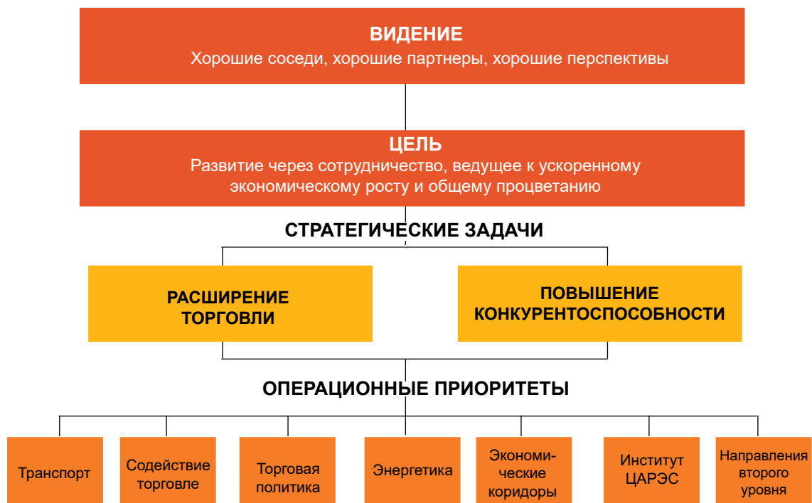
Рисунок 2. Общая институциональная структура ЦАРЭС