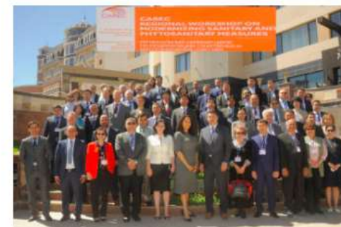
CAREC Regional Workshop on Modernizing Sanitary and Phytosanitary Measures