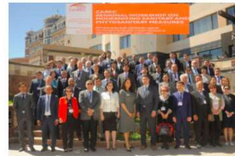
CAREC Regional Workshop on Modernizing Sanitary and Phytosanitary Measures